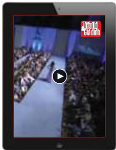
Dịch vụ quay video clip và đưa lên iPad