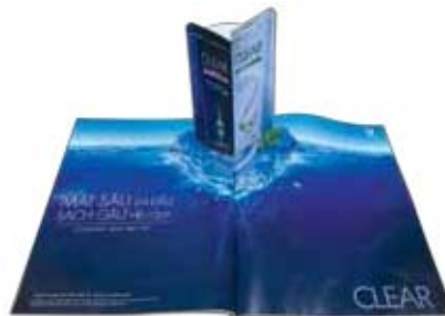
Dán Pop up vào trang quảng cáo