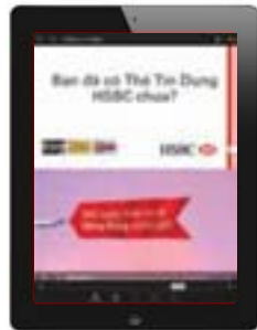
Tạo các hiệu ứng tương tác phong phú