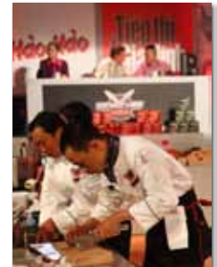
Cùng TT&GD tài trợ chính chương trình trên truyền hình